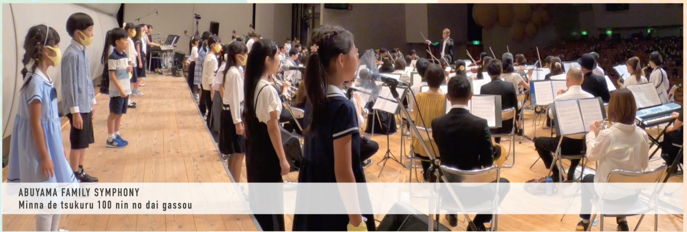
ABUYAMA FAMILY SYMPHONY Minna de tsukuru 100 nin no dai gassou

2002年、高槻市立阿武山小学校体育館で産声をあげた阿武山音楽祭は今回で21回目を迎えます。第3回より、みんなでひとつの合奏を創りあげる活動を通じて、地域の親睦を図り、子ども達の情操を育む趣旨のもと「100人の大合奏」を催して参りました。この大合奏のユニークな点は、地域に集う人々が大人と子ども、プロ・アマチュアの分け隔てなく参加し、大きな一体感と感動を共有することです。ピアノ・リコーダーのような身近な楽器から、オーケストラ楽器全般、ギターやドラムス等バンド楽器まで、実に30種類以上に及ぶ楽器編成を、オリジナルの編曲で演奏することで、全国的に見ても類を見ないユニークな活動と評価されています。